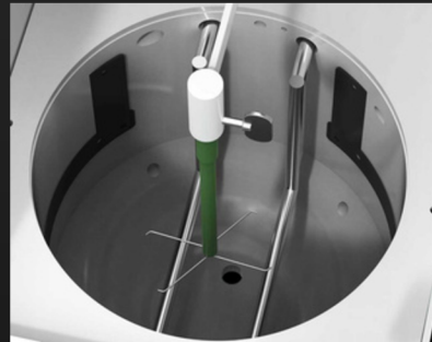
Données techniques au verso